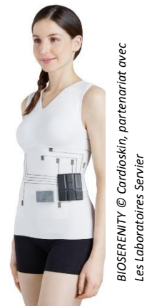
BIO SERENITY © Cardioskin, partenariat avec Les Laboratoires Servier

BioSerenity a développé un modèle d'affaires efficace en partenariat avec l'industrie pharmaceutique. Les partenariats reposent sur la création d'une solution technologique complète (dispositif physique, application mobile, cloud, analyse automatique des données par Intelligence Artificielle) centrée sur une pathologie dont le laboratoire pharmaceutique est spécialiste. Le laboratoire pharmaceutique utilise alors sa force de frappe pour déployer la solution dans le monde entier et bénéficie de son usage en interne pour ses essais cliniques.